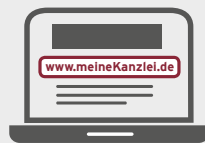
Adresse Ihrer Homepage eintragen