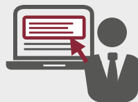
Codezeile kopieren und Ihren Quellcode einbetten