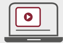
Vorteile von DWS-TAX-Video sofort nutzen